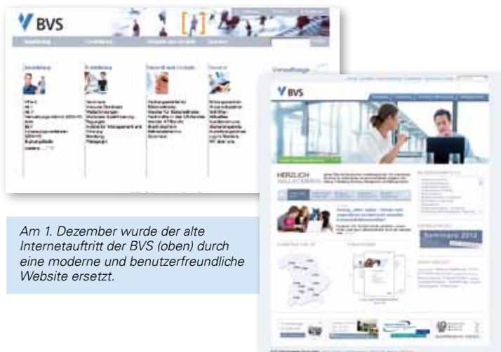
Am 1. Dezember wurde der alte Internetauftritt der BVS (oben) durch eine moderne und benutzerfreundliche Website ersetzt.

Haben Sie Lob, Anregungen, Fragen oder Kritik zum neuen Internetauftritt? Wir freuen uns auf Ihre Rückmeldung an wissenswert@bvs.de .