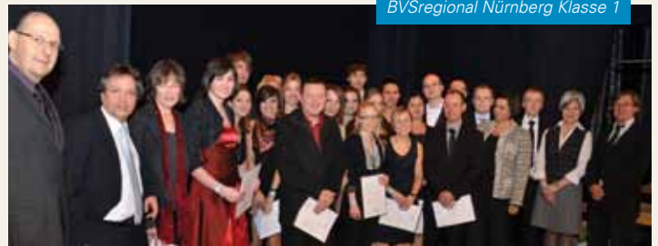
BVRegional Nürnberg Klasse 1