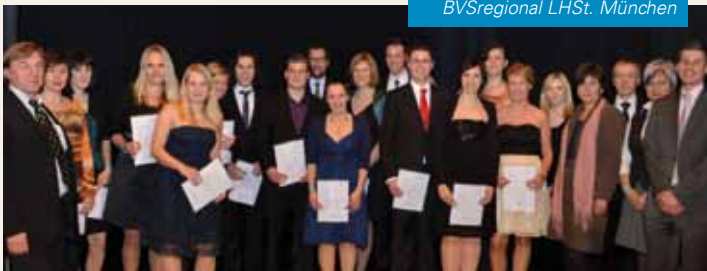
BVRegional LHSt. München