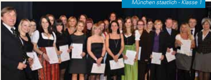
München staatlich - Klasse 1