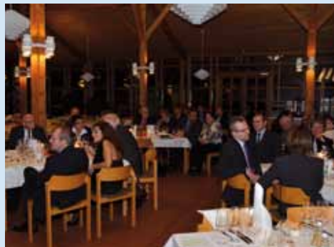
Die Gäste der „Dozentenehrung 2011“