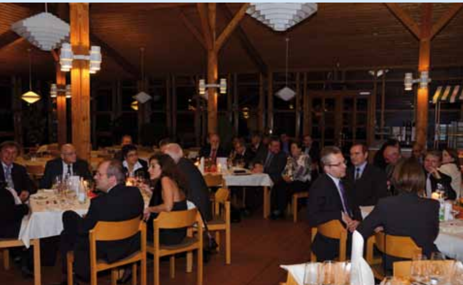
Die Gäste der „Dozentenehrung 2011“ im BVS-Bildungszentrum Holzhausen erwartete ein feierlicher Rahmen.

Die Bayerische Verwaltungsschule würdigte auch zum Ende des vergangenen Jahres wieder verdiente Dozentinnen und Dozenten. Die Feierstunde fand am 18. November 2011 im BVS-Bildungszentrum Holzhausen statt.