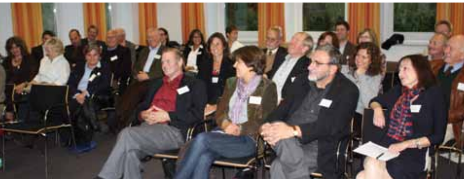
Die gespannt lauschenden Zuhörer/-innen des Vortragswettbewerbs 2011 in Holzhausen am Ammersee.

Ein Rückblick auf die gemeinsamen Veranstaltungen der BVS und des Vereins der Freunde der BVS