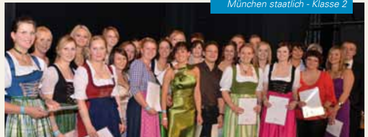
München staatlich - Klasse 2